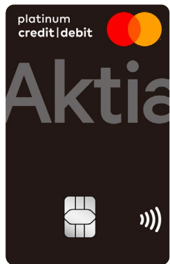
Aktia Platinum Credit/Debit